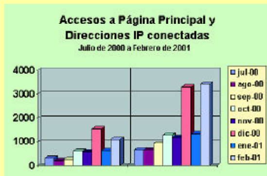
Figura 3. Accesos a la Página Principal (izquierda) y direcciones IP (derecha) conectadas al servidor Web.

Todo esto puede hacerse tal y como se ha estado haciendo desde su nacimiento, es decir poco a poco y a base de mucho esfuerzo, o bien podemos dar un salto cuantitativo a través de la colaboración de uno o más becarios -cuya contratación sólo es posible mediante el apoyo del sector empresarial- que permita hacer de esta Red Temática sin fines de lucro -eso es importante recalcarlo-, el sitio por excelencia y referencia de contenidos de calidad en materia de seguridad informática en toda Iberoamérica. ■