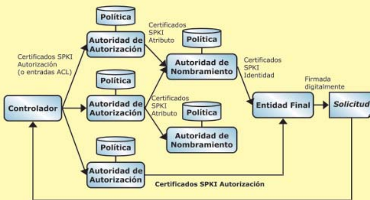
Figura 2. Estructura general de la gestión de autorización

Por otro lado, las autoridades encargadas de gestionar la pertenencia a roles se denominan bajo el nombre común de