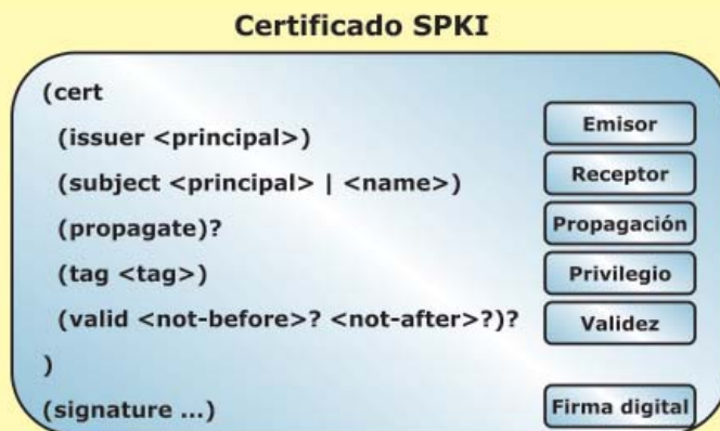
Figura 1. Certificado SPKI de autorización o atributo

Uno de los puntos principales de este artículo es mostrar cómo se ha llevado a cabo la definición de una infraestructura de autorización basada en SPKI/SDSI. Dicha infraestructura se apoya en los modelos de control de acceso basados en roles (RBAC) y en la delegación como herramienta fundamental de gestión de las autorizaciones. La otra cuestión clave aquí presentada es mostrar las posibilidades que ofrece el uso de los certificados de autorización a la hora de diseñar entornos de control de acceso. Para ello, se describirá la solución aplicada